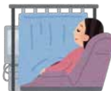
H28年度 女性のがん検診(乳がん・子宮頸がん検診) 契約医療機関一覧表